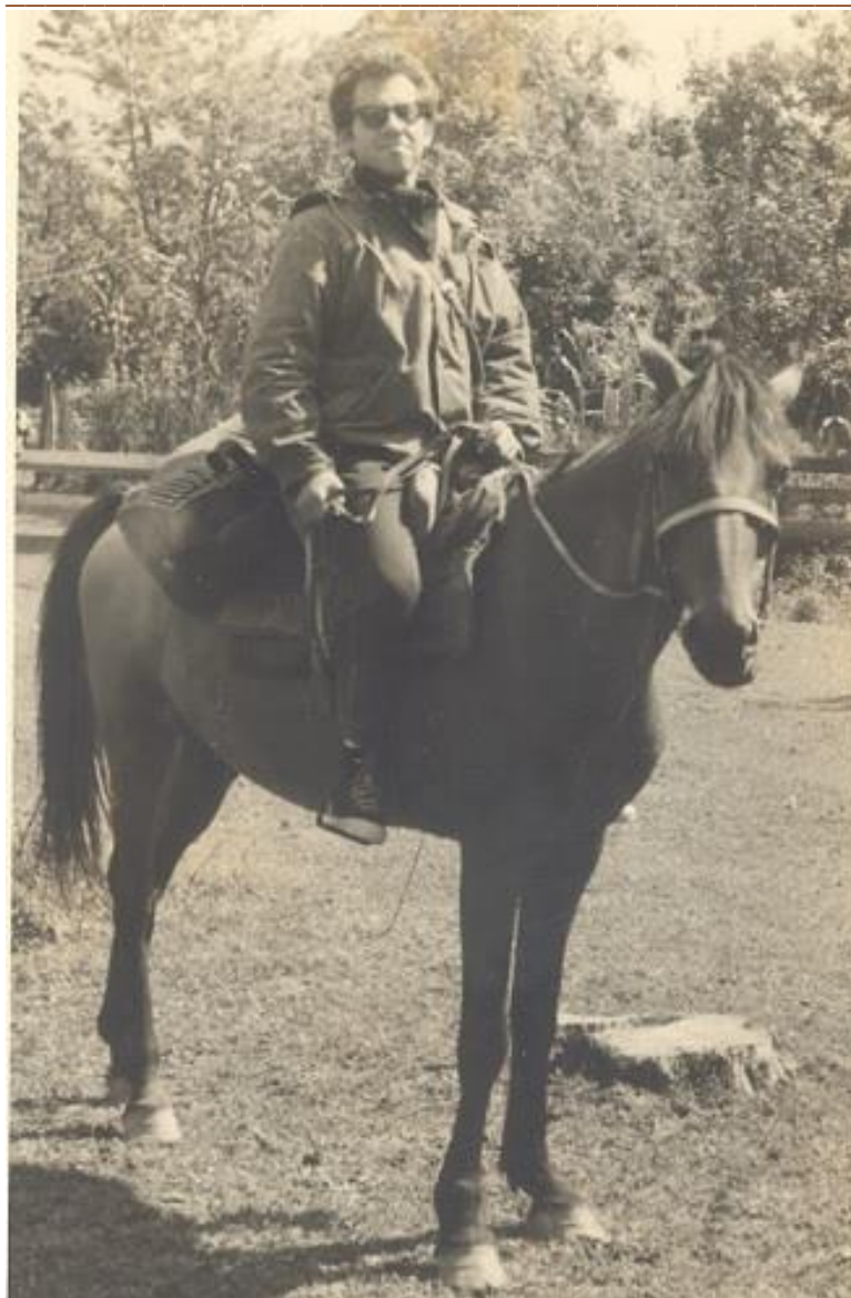
Белоканы. Б.Кавказ. 1970