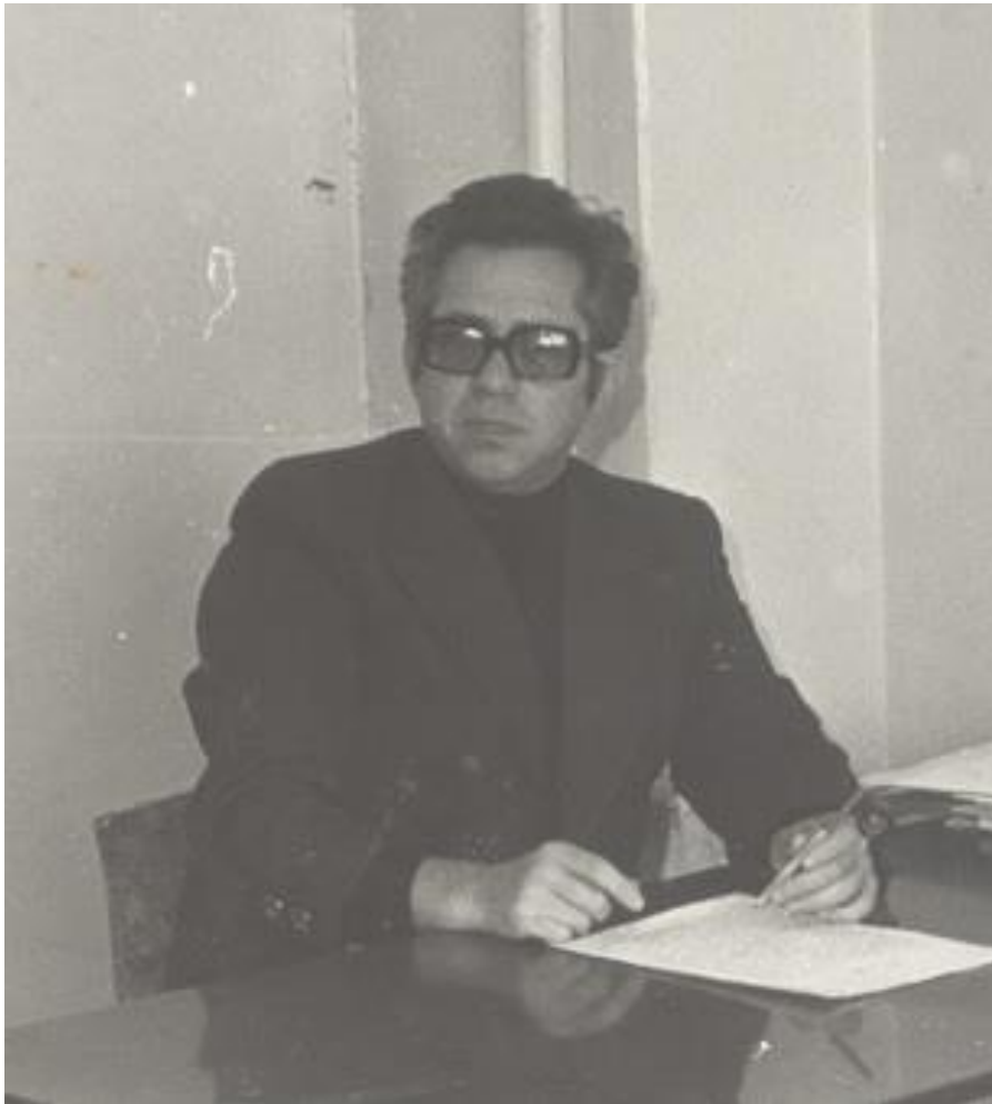
Составление отчёта. Баку. 1978