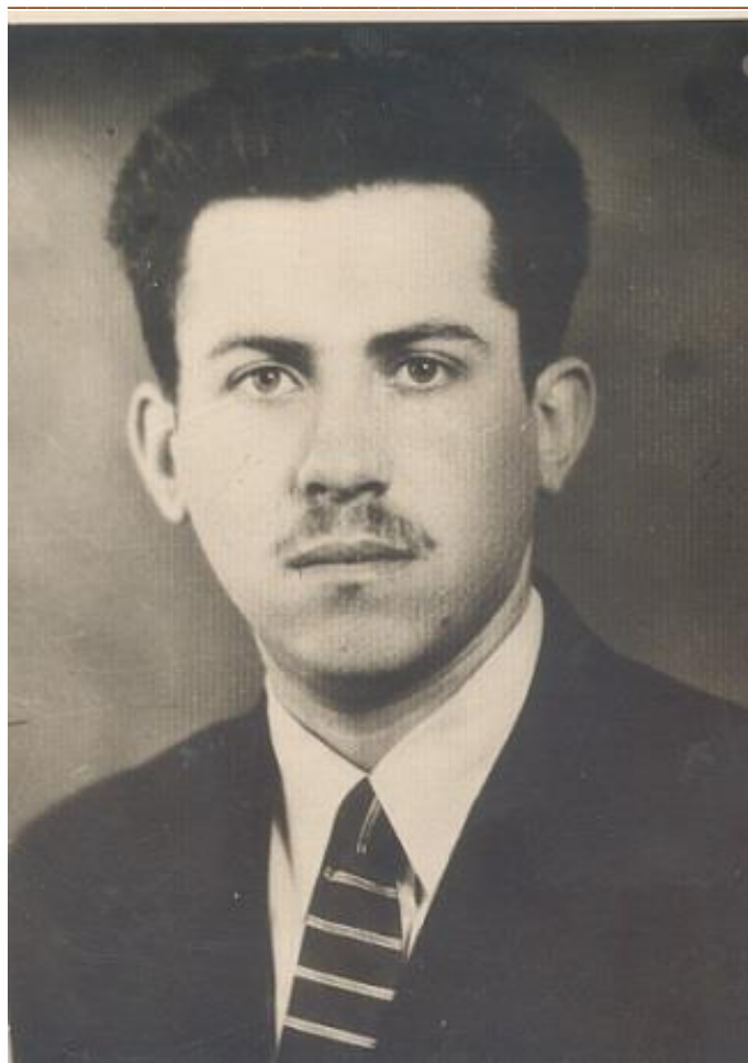
Свежеиспечённый специалист, "совсем корячий". 1960