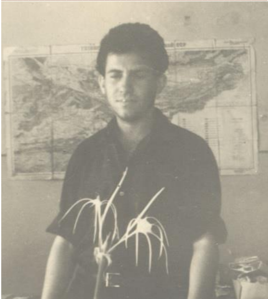
В камералке. Фрунзе. 1963